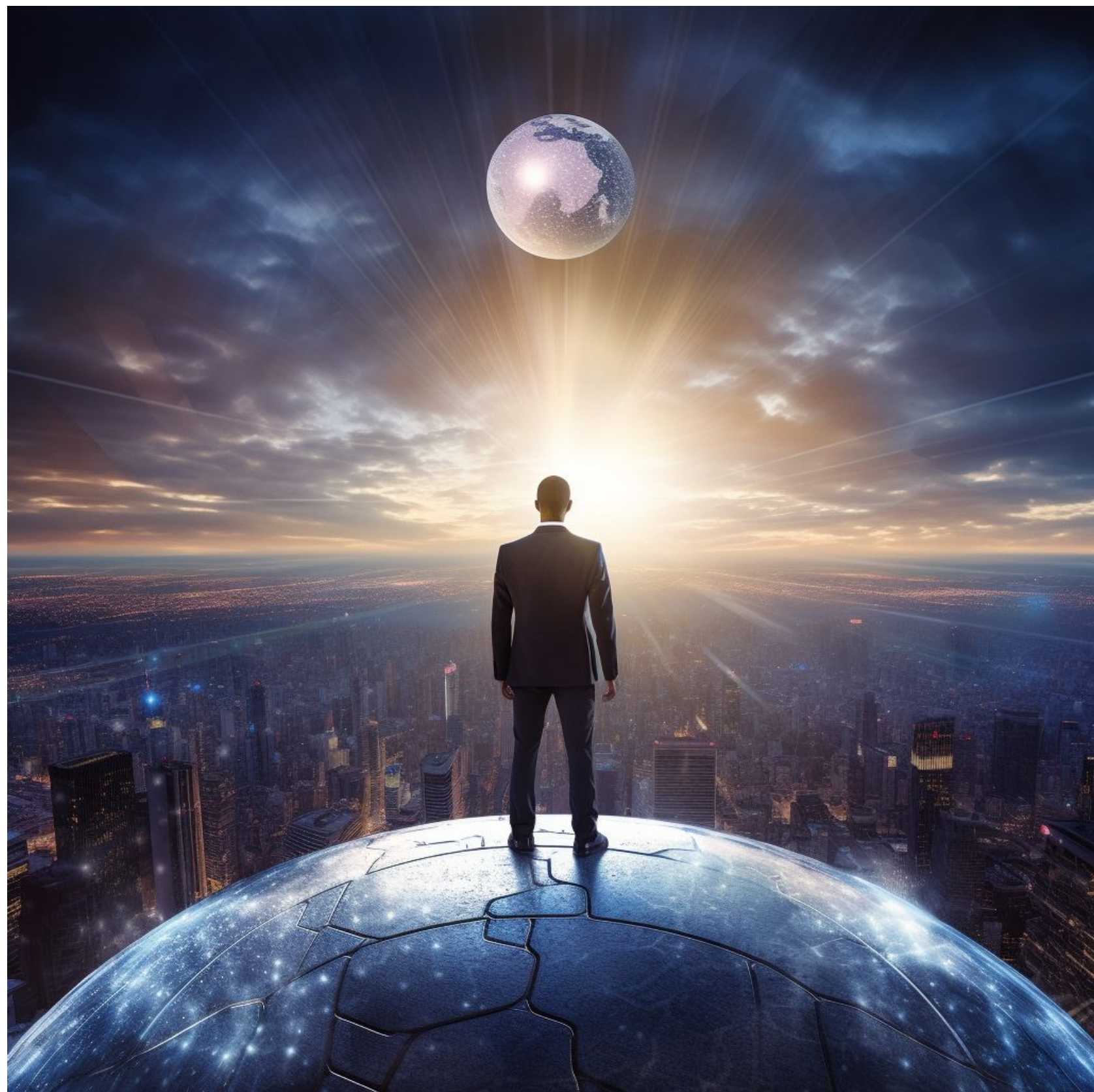
AI tolkar seminariet i bild