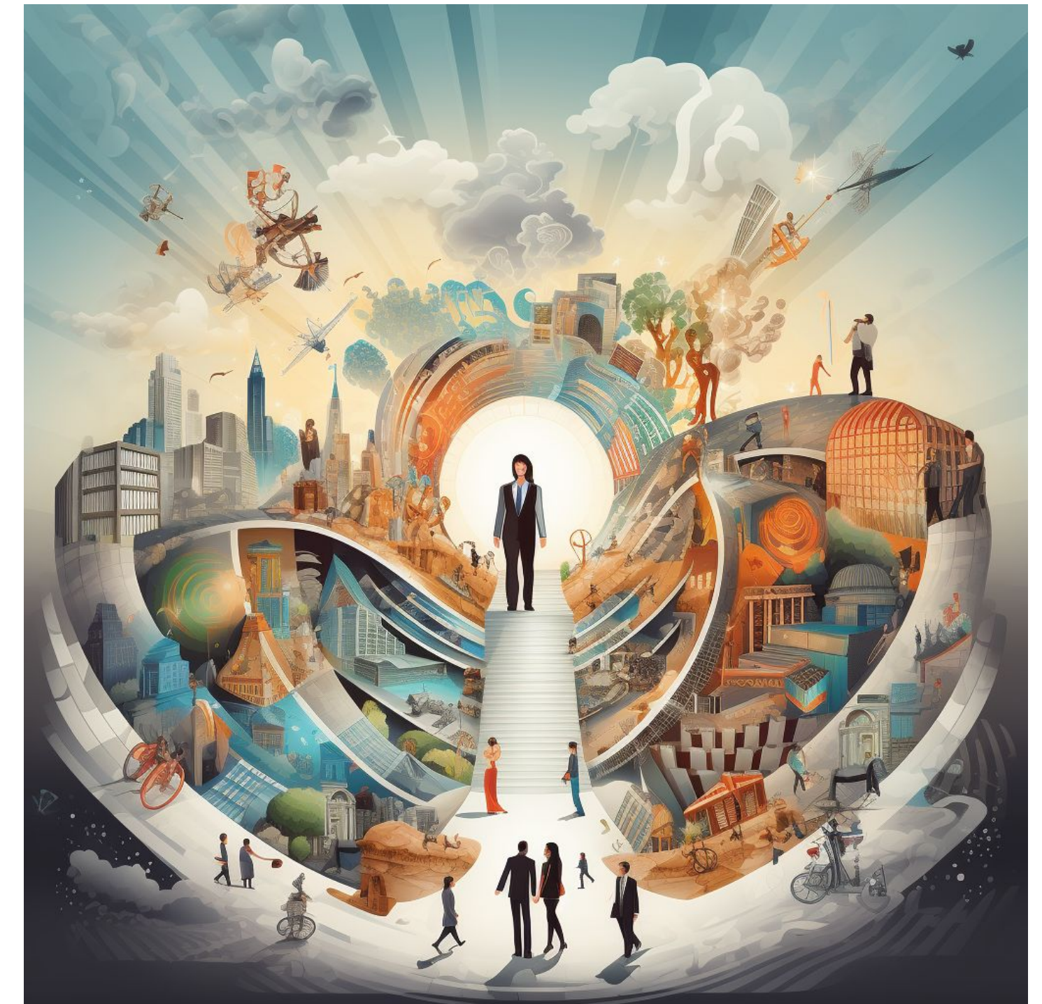
AI tolkar seminariet i bild

De betonade vikten av att inkludera fler i entreprenörskapet, minska trösklarna för att starta företag och fortsätta utveckla kompetensen hos både entreprenörer och anställda.