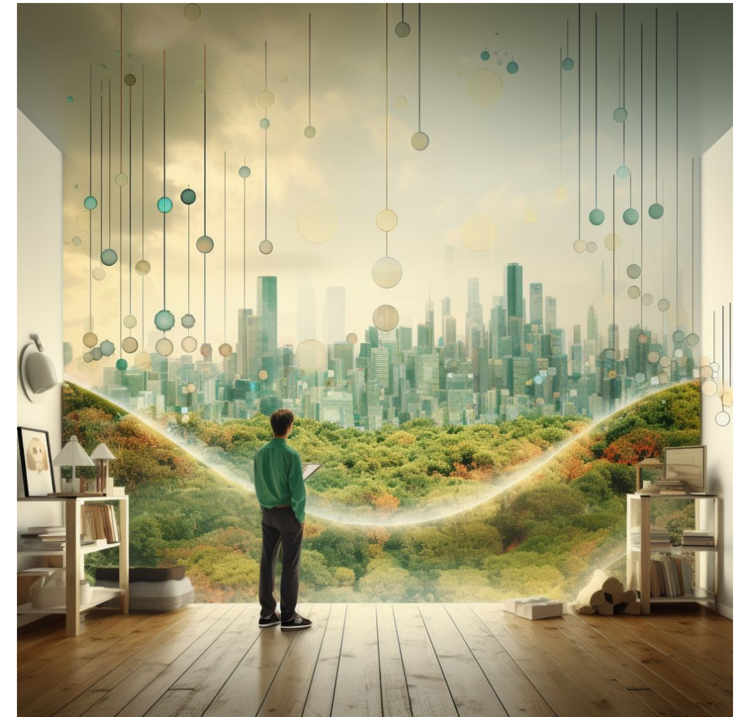
AI tolkar seminariet i bild

Lösningar som användning av standarder, samverkan och innovation lyftes fram som sätt att främja hållbarhet.