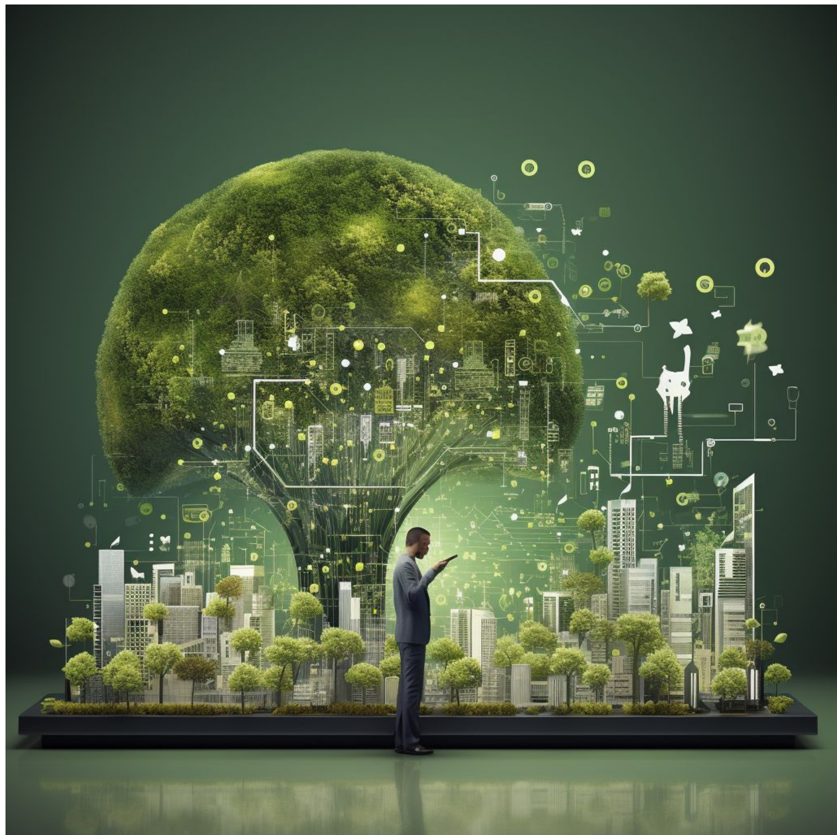
AI tolkar seminariet i bild